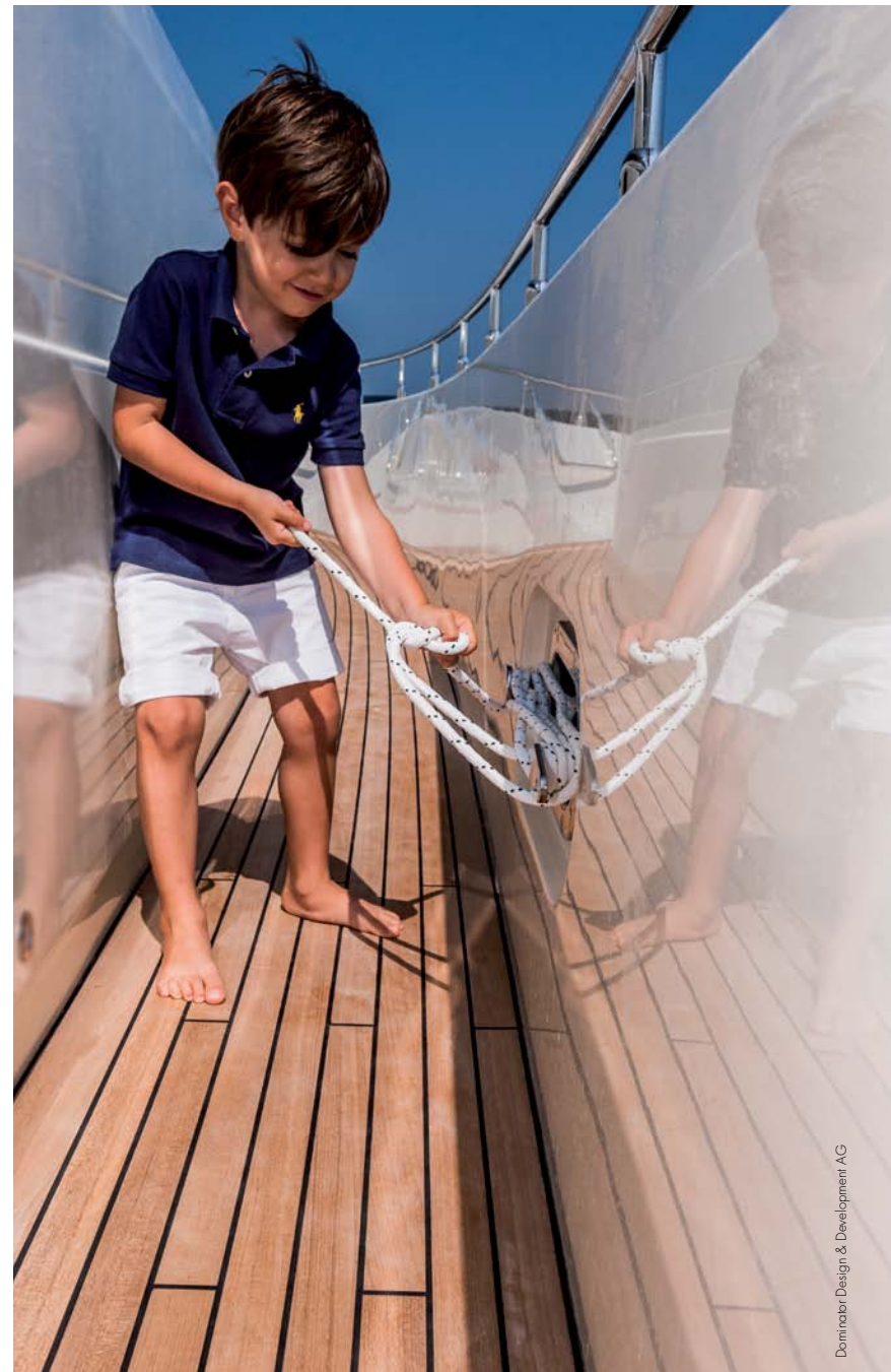
Dominator Design & Development AG

Redundant safety and stability systems guarantee safety at sea for the whole family.