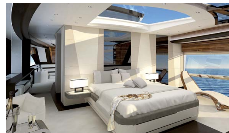
In der Ilumen-Eigenerkabine verschwimmen die Grenzen zwischen Innen- und Außenraum. Boundaries between interior and exterior space are blurred in the Ilumen owner's cabins.